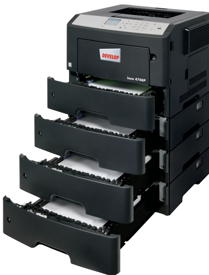
ineo 4700P mit drei zusätzlichen Papierkassetten (PF-P12)

Ist Ihr derzeitiges Drucksystem unübersichtlich und schwer zu bedienen? Dann steigen Sie um auf die ineo 4700P. Das 2,4-Zoll Farbdisplay ist intuitiv zu bedienen und hervorgehobene Menüs zeigen dem Benutzer den Systemstatus sowie ausgewählte Bedienungsoptionen und -einstellungen. Mehr noch – die Navigation über Ordnerstrukturen ist übersichtlich und erleichtert Ihnen die Bedienung. Der Bedienkomfort wird Sie und Ihr Team sofort positiv beeindrucken und es bleibt mehr Zeit für die wichtigen Kernaufgaben. Und bei der ineo 4700P brauchen Sie kein umfangreiches Bedienungshandbuch zu fürchten: sie lässt sich intuitiv bedienen.